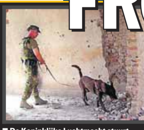
De Koninklijke Luchtmacht stuurt binnenkort bomspeurhonden naar Oeroezgan. Eerder al waren ze actief in de Afghaanse hoofdstad Kaboel.